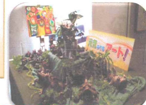
50周年記念行事での展示の一コマ

今年度の「元気の でるアート!」の 活動が終了しま した。 いろいろな所で 展示が出来まし た。ありがとうございました。